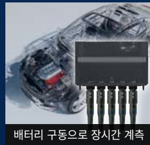
배터리 구동으로 장시간 계측

전류 모듈 1대에 센서 5개를 연결할 수 있으며, 무선 모듈은 배터리 구동만으로 5시간 이상 작동합니다.