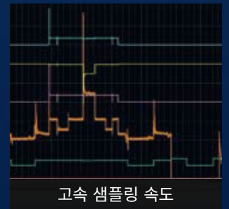
고속 샘플링 속도

전류 모듈 1대에 센서 5개를 연결할 수 있으며, 무선 모듈은 배터리 구동만으로 5시간 이상 작동합니다.