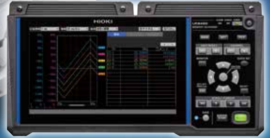
메모리 하이로거 LR8450, LR8450-01